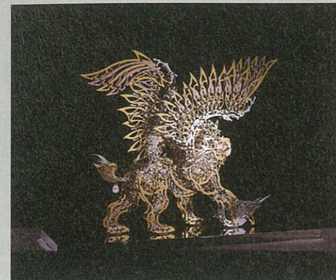
席時斌《威尼斯的雄獅》·不鏽鋼、鈦金鍍膜·95×116×24 cm·2016。

度過2016年藝術市場的微幅下跌，從今年2017上半年度的幾場藝術博覽會打出亮眼成績的銷售情況看來，亞洲藝術市場依然處於穩定上升期。在平均銷售作品數量上，香港巴塞爾（Art Basel Hong Kong）在今年銷售件數幾近2016年的兩倍之多，每一畫廊的平均銷售數量接近5件。藝術北京的參展畫廊們則在作品銷售策略以中低價位為主打，打開新手藏家的入門之路。剛於7月底閉幕的台中藝術博覽會，在今年的展出期間也由新人藝術家與小規模作品創下亮眼的銷售佳績。展現當前藝術市場不再專美於超級藝術家，藏家年齡層年輕化的趨勢，讓新晉藝術家更有機會獲得青睞，精緻化的購藏模式成為一股新風氣。