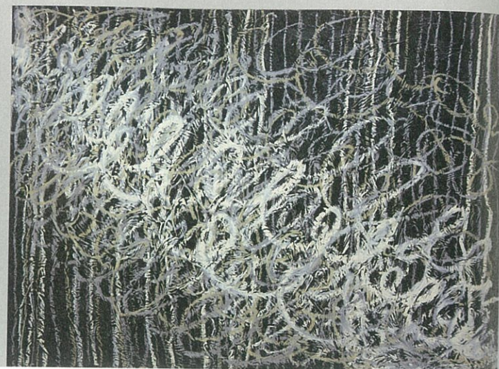
右 謝貽娟《None-Space M13》·混合媒材、畫布· 57×76.5 cm·1995。