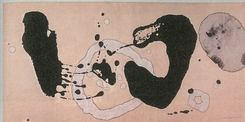
侯珊瑚《態象系列TB151》·紙本水墨·24×248 cm·2015。