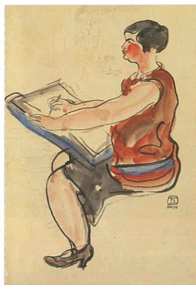
常玉 著紅衣作畫中的女子 1930 水彩紙本 45.5×31cm

際參展經驗，持續將主題策展形式的概念帶進藝博會，試圖改變藝博會參展畫廊單一商業操作的僵化模式。