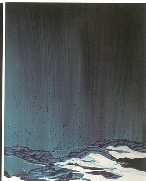
黃品玲 Sound of Rain 2017 油彩畫布 162×130cm

來東方畫會藝術家朱為白以西方抽象形式探索中國傳統人文精神的創作。上海龍門雅集帶來五月畫會與東方畫會重要成員莊喆和蕭勤的抽象畫作；八大畫廊則推出許東榮複合媒材的抽象創作。