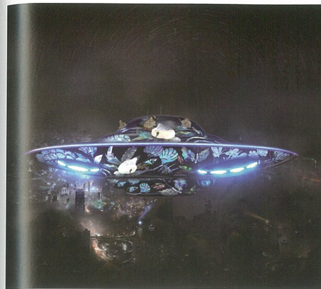
李二男 Reborn Light-Mother of Pearl 2016 LED液晶電視、錄像 7'40"，每件130×77×13cm

2017年台北國際藝術博覽會，誠品畫廊主推台灣第一位抽象畫家，也是東方畫會創始成員陳道明的個展。亞洲藝術中心同樣帶