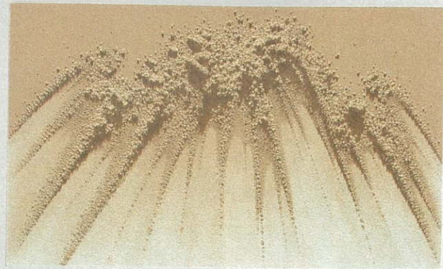
左 Chang Young KIM《S.P 9909-F》· oil on sand on canvas 110×182 cm · 2003 · (模樂德畫廊提供)