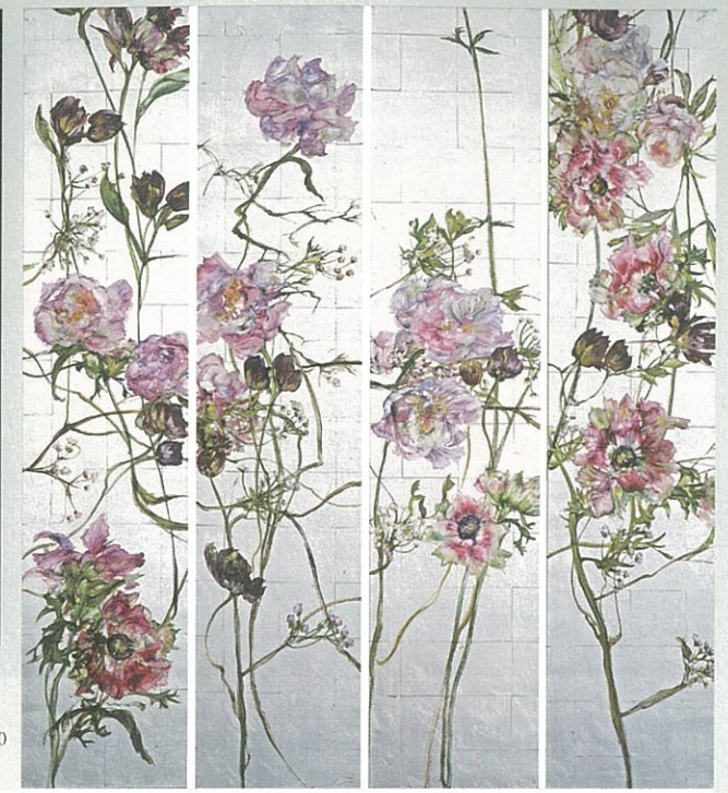
右 Claire BASLER 《銀箔、牡丹櫻桃鬱金香4、5、6、7I》· 布面銀箔油畫 · 230×200 cm · 2016。

線」和「從點」(From Point From Line)版畫系列及Changyoung KIM和Pumme HONG等人的作品。韓國朴榮德畫廊Galerie Bhak同樣主推單色畫藝術家BUP Kwan抽象創作，反映東方文人畫無為的冥想狀態。YOD Gallery將展出在六〇和七〇年代「物派」中心人物關根伸夫(Nobuo SEKINE) 2016年的新作。