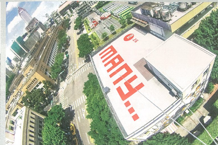
左 樊洲《深水靜流》· 紙本水墨 · 600×248 cm · 2017 · (太和藝術空間提供)

第一場「當代水墨藝術的鑑往知來」由中國藝術家會策展委員會副主任皮道堅，和資深藝術領域教學者高千惠，對談當代水墨藝術的演進與各式闡釋。第二場與典藏合作