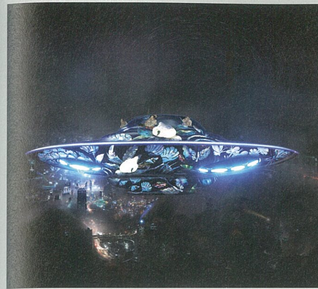
左 Leenam LEE 《Reborn Light-Mother of Pearl》· LED TV ... · 130×77×13 cm (each) · 2016。

第三度參加Art Taipei的日本TEZUKAYAMA畫廊將主推「物派」也是韓國單色畫(Dansaekhwa)領導先驅李禹煥(LEE Ufan)最重要的「從