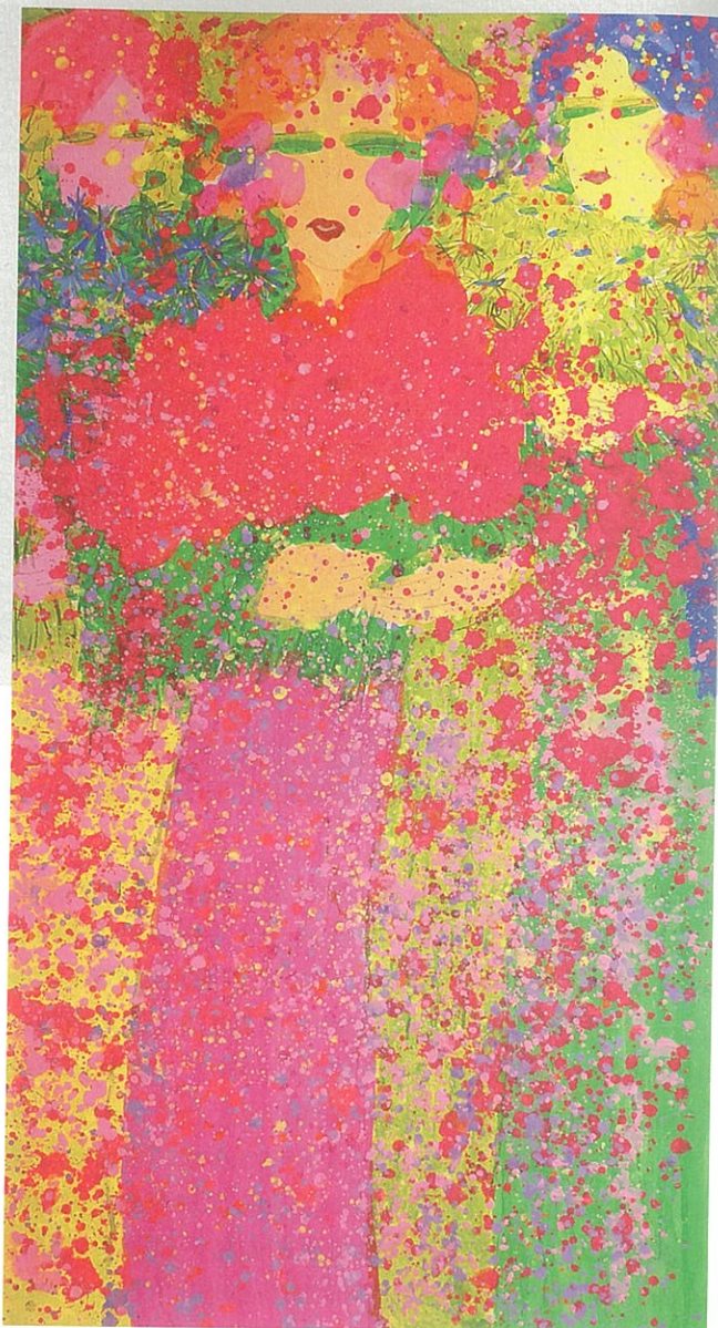
右 丁雄泉《手執花束的三美女》· 紙上墨、塑膠彩 · 180×96 cm · 1990